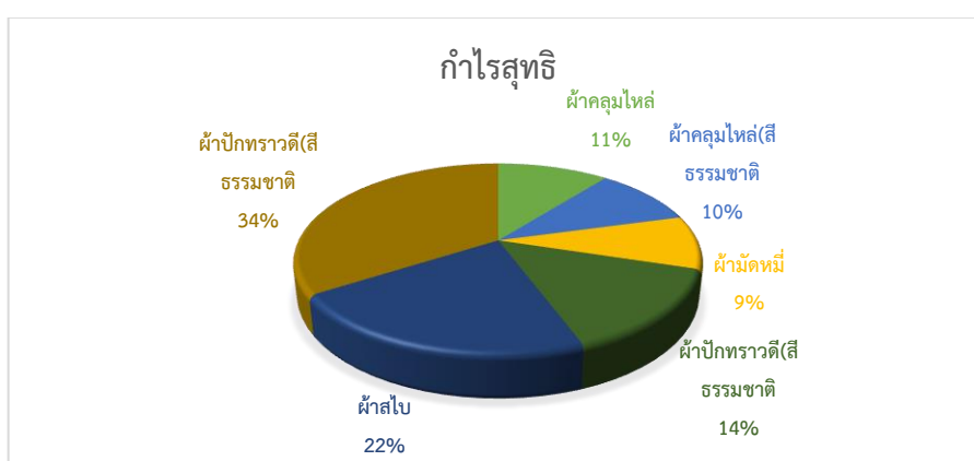
ภาพ 2 แสดงการเปรียบเทียบผลกำไรสุทธิ